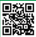
Web QR Kod

Mersin Tarsus Organize Sanayi Bölgesi 10. Cadde No:8 D Blok Akdeniz / Mersin / TURKEY e-mail: oner@oner.com.tr