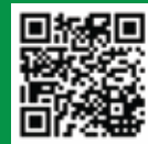
Facebook QR Kod